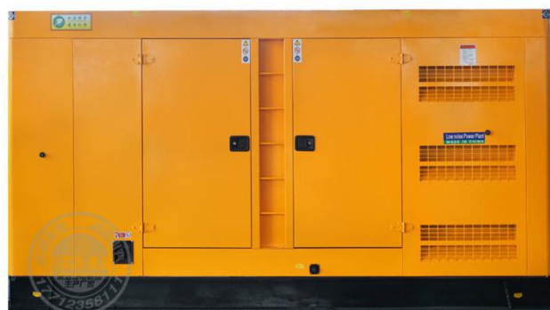
静音型机组（需选装）